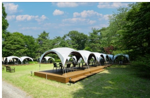
リゾートガーデン バーベキュー