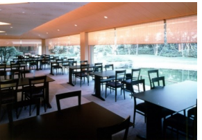
日本料理 昭和の森 車屋